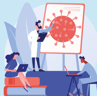
HPV EDUCATION PROGRAMS